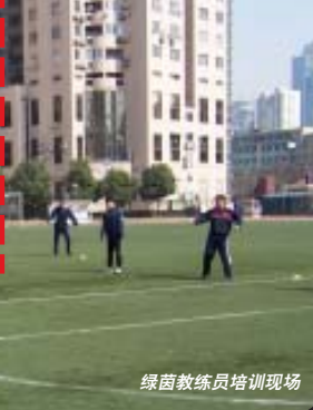
绿茵教练员培训现场