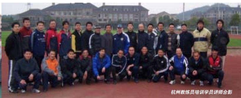
杭州教练员培训学员讲师合影