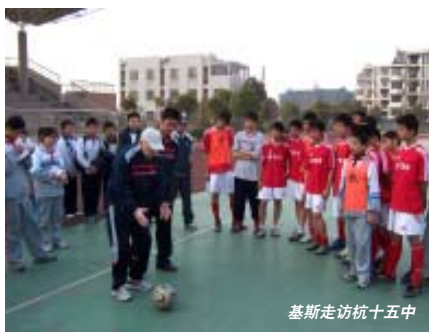
基斯走访杭十五中

卖鱼桥小学一直致力于让更多的孩子接触足球运动，感受足球运动；并坚持经常化的训练与授课，通过足球教育，来培养学生的顽强拼搏，合作团结等品质。同时更寻找、创造机会让学生们开拓视野，多多接触了解足球的深层意义。